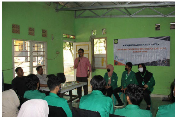
Gambar 1 : pembukaan dan sambutan program KKN