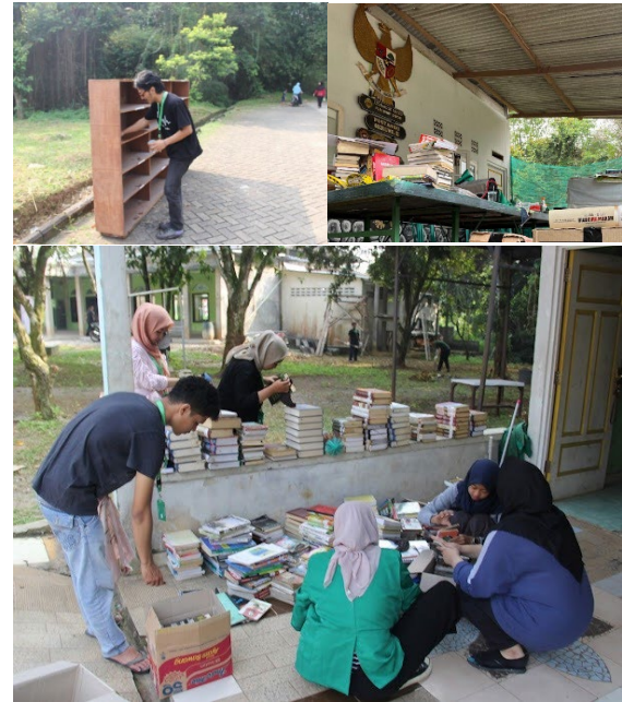
Gambar 2 : memilah buku dan membersihkan rak serta memindahkan salah satu rak ke Masjid Assalam

Adapun buku yang tidak layak pakai hanya 3 (tiga) hal ini karena kondisi buku sudah robek, lapuk dan usang sisa buku yang lain masih dalam kondisi baik dan dapat digunakan. Buku yang mencakup pengetahuan lain yakni motivasi, kuliah, entrepreneur, sejarah, dan kamus. Rak buku yang di simpan di Balai Warga ada 2 (dua) salah satunya dipindahkan ke masjid untk kegiatan TPA (Tempat pembelajaran Al-Qur'an) yang disi dengan buku-buku yang berkaitan dengan agama.