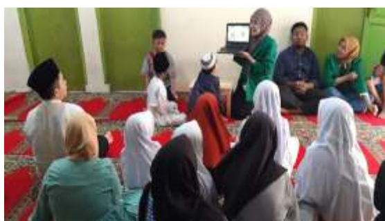
Gambar 3. Pemaparan Materi Vertikultur Oleh Tim KKN

Kegiatan pelatihan vertikultur ini berlangsung pada hari Minggu tanggal 7 Agustus 2022. Sebelum membuat vertikultur, dilakukan terlebih dahulu sebuah kegiatan sosialisasi kepada peserta pelatihan yang dihadiri oleh 29 anak-anak Panti Asuhan Da'arul Ulum. Sosialisasi dilakukan supaya peserta memiliki pemahaman yang baik, kemampuan membuat vertikultur yang terampil, dan mempunyai motivasi dan kesadaran yang tinggi dalam membuat vertikultur. Sosialisasi diberikan dalam bentuk penyampaian materi oleh tim KKN. Materi yang disampaikan berisi permasalahan lingkungan, tujuan kegiatan, manfaat dan teknis pembuatan vertikultur dengan pemanfaatan limbah botol plastik.