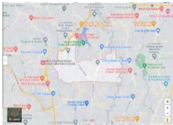
Gambar 1. Peta Lokasi Yayasan Panti Asuhan Da'arul Ulum, Pisangan, Ciputat Timur.

Kelurahan Pisangan yang terletak pada bagian utara berbatasan dengan kelurahan Cirendeu atau Karang Tengah-Jakarta Selatan. Untuk selatan berbatasan dengan kelurahan Cipayung atau Pondok Cabe Udik, sebelah timur berbatasan dengan kelurahan Pondok Cabe Udik atau Cinere Sawangan Depok dan pada sebelah barat yang berbatasan dengan kelurahan Cipayung atau Cempaka Putih.