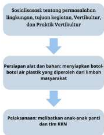
Gambar 2. Tahapan Pelatihan Budidaya Vertikultur