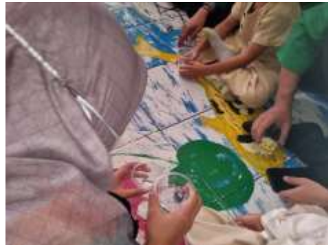
Gambar 4. Praktek penanaman kacang hijau

Kami berharap setelah dilaksanakannya KKN UMJ oleh Kelompok 87 ini anak-anak di PAUD Nurul Ikhlas dapat menumbuhkan sikap tanggungjawab dan peduli terhadap lingkungan disekitarnya.