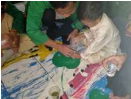
Gambar 3. Membimbing anak-anak tahapan penanaman