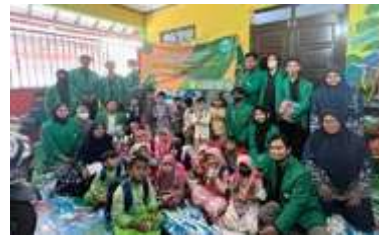
Gambar 2. Foto bersama siswa/siswi dan guru di Paud Kb Nurul Ikhlas

Sebelum dilaksanakannya metode penyuluhan untuk para siswa/siswi Paud Kb Nurul Ikhlas, kami terlebih dahulu memperkenalkan diri kepada para siswa/siswi Paud kb Nurul Ikhlas agar mereka dapat mengenal kami. Setelah itu kami menjelaskan detail apa itu membudidayakan literasi dan seberapa penting literasi bagi kehidupan dan mempraktikannya langsung dengan tujuan agar kami dapat mengetahui apakah siswa/siswi Paud Kb Nurul Ikhlas sudah memahami mengenai materi yang sudah kami sampaikan serta agar siswa/siswi Paud Kb Nurul Ikhlas dapat mempraktikannya dalam kehidupannya sehari-hari.