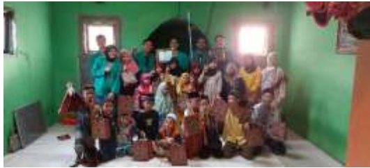
Gambar 2. Foto Bersama Anak-Anak TPQ Hidayah.