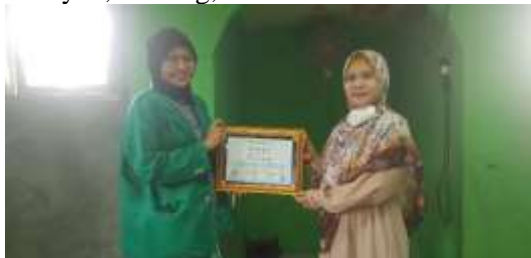
Gambar 3. Penyerahan Sertifikat.