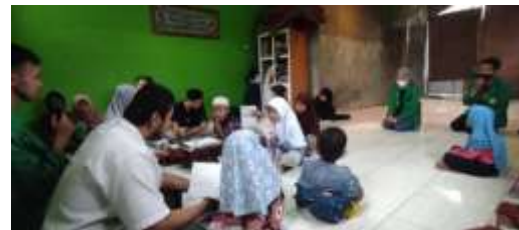
Gambar 1 Keadaan TPQ Hidayah.

di Taman Pendidikan Al-Quran (TPQ) Hidayah yang berlokasi di Jl. Anggrek Raya, RT. 10 RW 06, Jatinegara, Kec. Cakung, Kota Jakarta Timur, Daerah Khusus Ibukota Jakarta 13930. Kebanyakan dari orang tua mereka adalah orang pendatang yang ingin mencari pekerjaan di Jakarta sehingga mereka membuat permukiman sendiri di lahan kosong milik pemerintah setempat. Latar belakang pekerjaan orang tua mereka adalah pengumpul barang bekas yg membuat anak yang berada di Taman Pendidikan Al-Quran (TPQ) Hidayah hidup dibawah garis kemiskinan. Anak – anak yang mengaji di Taman Pendidikan Al-Quran (TPQ) Hidayah duduk dibangku sekolah dimulai dari kelas 2 SD sampai yang paling besar adalah anak kelas 9 SMP. Anak di Taman Pendidikan Al-Quran (TPQ) Hidayah Kebanyakan mendapatkan pelajaran Teknologi Informasi dan Komunikasi (TIK) di sekolahnya tetapi hanya materi saja dan tidak ada praktik langsung, oleh karena itu kemampuan anak-anak Taman Pendidikan Al-Quran (TPQ) Hidayah mengenai penggunaan teknologi informasi sangatlah kurang. Menurut Innovators and experts in computer technology mengatkan dari 239 juta penduduk Indonesia, orang yang melek teknologi hanya 10 persen atau sebanyak 23,9 juta.