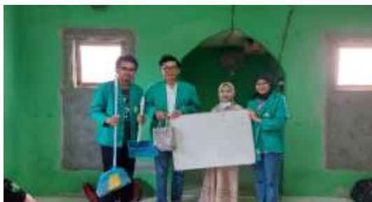
Gambar 4. Penyerahan Cenderamata.

Penyuluhan literasi teknologi sangatlah penting karena melalui penyuluhan literasi teknologi menggunakan Microsoft Word ini mampu meningkatkan kemampuan dan pengetahuan anak-anak di Taman Pendidikan Al-Quran (TPQ) Hidayah mengenai Microsoft Word sebagai salah satu aplikasi teknologi informasi yang wajib dan harus bisa di mereka gunakan karena aplikasi tersebut merupakan aplikasi dasar bagi anak-anak di sekolah. Karena jika kemampuan akan penggunaan aplikasi Microsoft Word ini baik maka akan