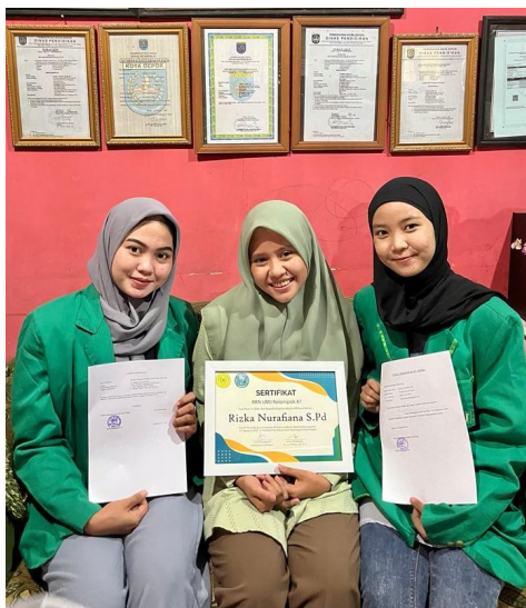
Gambar 9. Pemberian Cendramata pada guru di Paud Kb Nurul Ikhlas