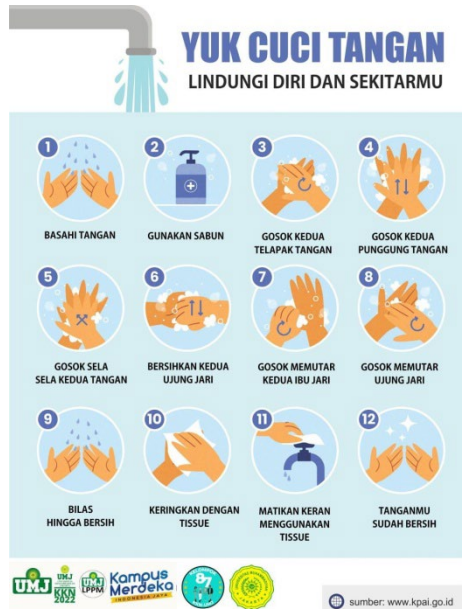
Gambar 4. Poster mengenai langkah-langkah cuci tangan

Setelah menyampaikan materi kepada siswa/siswi Paud Kb Nurul Ikhlas. Anak-anak tersebut langsung mempraktikkannya di dalam lingkungan sekolah dan mahasiswa pun juga membimbing langkah-langkah mencuci tangan yang baik dan benar yang diharapkan jika langsung dipraktikkan siswa/siswi tersebut dapat memahami materi yang diberikan dan dapat diimplementasikan secara langsung