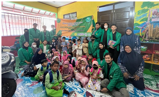
Gambar 8. Foto bersama siswa/siswi dan guru di Paud Kb Nurul Ikhlas