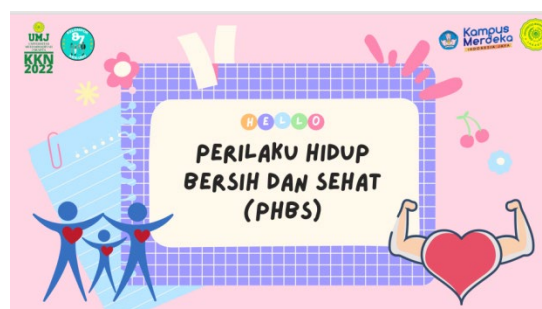
Gambar 2. Materi perilaku hidup bersih dan sehat (PHBS)

Setelah melakukan ice breaking , agenda selanjutnya ialah materi penyuluhan mengenai perilaku hidup bersih dan sehat (PHBS) yang disampaikan oleh Alya Agustina. Materi yang disampaikan berisi mengenai apa itu PHBS, alasan mengapa perlu PHBS, dan apa yang harus dilakukan.