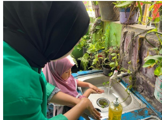
Gambar 6. Praktik cuci tangan dengan baik dan benar

Setelah melakukan cuci tangan, agenda selanjutnya ialah makan siang dengan bekal yang sudah disiapkan oleh masing-masing siswa/siswi yang sudah mereka bawa dari rumah untuk makan siang bersama teman-teman dan juga bersama mahasiswa KKN kelompok 87