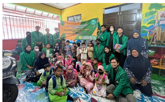
Gambar 1. Foto bersama siswa/siswi dan guru di Paud Kb Nurul Ikhlas

Sebelum dilaksanakannya metode penyuluhan untuk para siswa/siswi Paud Kb Nurul Ikhlas, kami terlebih dahulu memperkenalkan diri kepada para siswa/siswi Paud kb Nurul Ikhlas agar mereka dapat mengenal kami. Setelah itu kami menjelaskan secara mudah mengenai perilaku hidup bersih dan sehat (PHBS) dan mempraktikannya langsung dengan tujuan agar kami dapat mengetahui apakah siswa/siswi Paud Kb Nurul Ikhlas sudah memahami mengenai materi yang sudah kami sampaikan serta agar siswa/siswi Paud Kb Nurul Ikhlas dapat mempraktikannya dalam kehidupannya sehari-hari.