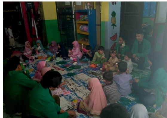
Gambar 7. makan siang bersama teman-teman dan juga bersama mahasiswa KKN kelompok 87

Setelah melakukan cuci tangan, agenda selanjutnya ialah makan siang dengan bekal yang sudah disiapkan oleh masing-masing siswa/siswi yang sudah mereka bawa dari rumah untuk makan siang bersama teman-teman dan juga bersama mahasiswa KKN kelompok 87