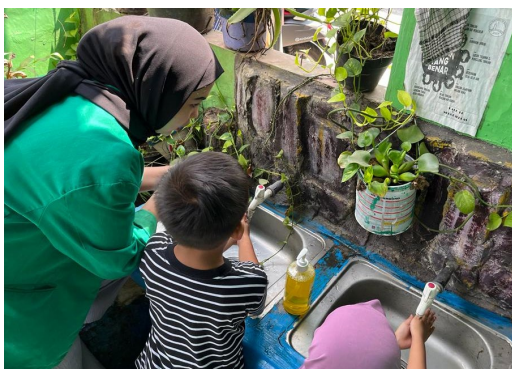
Gambar 5. Praktik cuci tangan dengan baik dan benar

Setelah menyampaikan materi kepada siswa/siswi Paud Kb Nurul Ikhlas. Anak-anak tersebut langsung mempraktikkannya di dalam lingkungan sekolah dan mahasiswa pun juga membimbing langkah-langkah mencuci tangan yang baik dan benar yang diharapkan jika langsung dipraktikkan siswa/siswi tersebut dapat memahami materi yang diberikan dan dapat diimplementasikan secara langsung