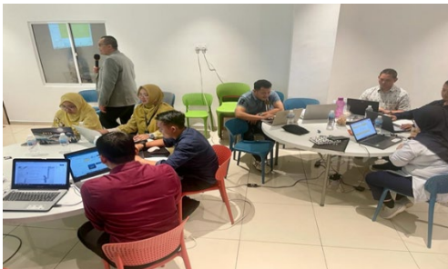
Gambar. 2 Proses Pelatihan

(Arumingtyas, 2021). Google Sites menyediakan social links yang dapat disesuaikan dan opsi pencarian yang dapat dikelola untuk memudahkan pengguna dalam menghubungkan situs web dengan media sosial dan memudahkan pengguna dalam mencari konten di situs web (Harsanto, 2017).