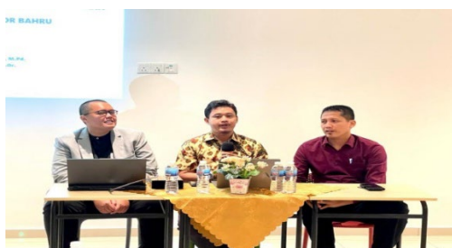
Gambar. 1 Pembukaan PKM di SIJB

Ada beberapa materi yang dibahas dalam pelatihan ini yakni: