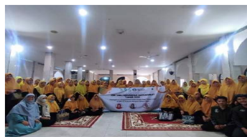
Gambar 3. Foto Bersama Seluruh Peserta

Setelah pemaparan materi, peserta diperbolehkan menanyakan hal-hal terkait wakaf, termasuk kasus-kasus yang mungkin dialami dalam hal pengelolaan wakaf. Pada sesi ini terdapat 3 orang penanya dari jamaah Majelis Taklim Ar Rahmah. Setelah sesi ini berakhir, kegiatan diakhiri dengan foro bersama peserta yang hadir pada kegiatan ini.