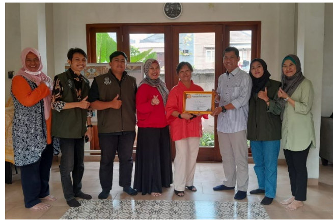
Gambar 5. Foto Bersama dan Penyerahan Sertifikat