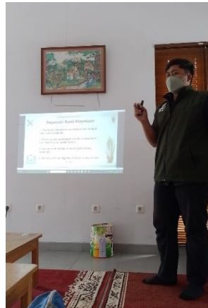
Materi : Formulir