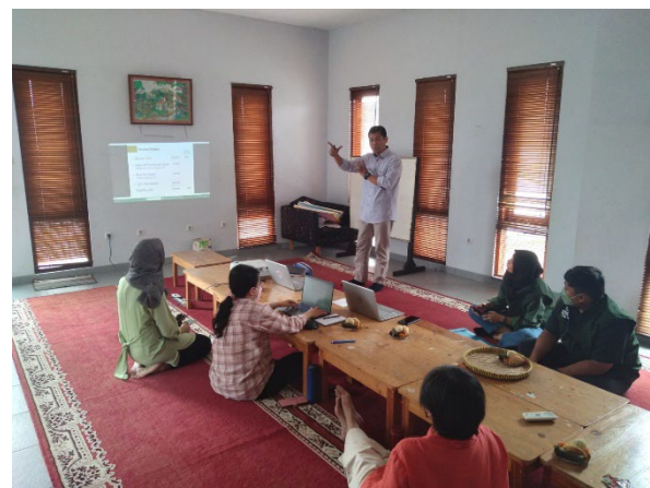
Materi : Menghitung HPP