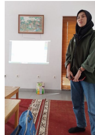
Materi : SOP