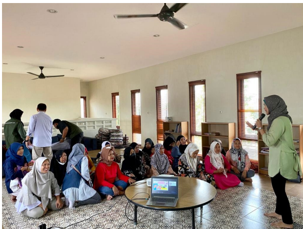
Materi : Pola Hidup Sehat