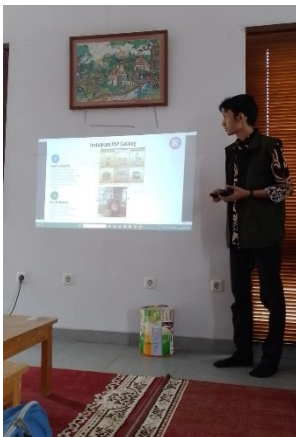
Materi : Media Sosial

Keputusan, Formulir dan Standard Operating Procedure . Materi ini menjelaskan pentingnya dokumen tertulis atas setiap penugasan atau pelaksanaan pekerjaan, sehingga pengendalian internal dan pertanggungjawaban dapat terselenggara dengan baik. Materi keempat membahas tentang Harga Pokok Produksi dan Penjualan . Tim menjelaskan pentingnya perhitungan harga pokok produksi sebagai bagian dari perhitungan keuntungan, ketika produk dijual dan menghasilkan pendapatan. Dalam beberapa hal, terdapat perbedaan teknik perhitungan harga pokok antara yang dilakukan saat ini dengan materi yang disampaikan oleh tim, dan hal ini menjadi diskusi yang menarik dan akan ditindaklanjuti.