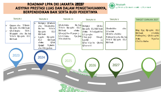
Gambar 5 Road Map Program kerja LPPA PWA DKI Jakarta

Road map program kerja LPPA PWA DKI Jakarta merupakan program kerja yang dirancang dalam pelaksanaan program kerja yang dilaksanakan pada tahap tahunan kegiatan dengan perancangan pada tahap tahun 1 : pada penguatan profil, sejarah 'Aisyiyah DKI Jakarta, dan Penetapan SDM, Aktivitas dan Amal usaha 'Aisyiyah. Tahap tahun ke 2 diantaranya : Analisisn peluang dan tantangan pada amal usaha 'Aisyiyah dan Kiprah 'Aisyiyah pada politik nasional. Tahap tahun ke III : penguatan pada amal usaha 'Aisyiyah DKI Jakarta pada bidang pendidikan, ekonomi, kesehatan dan sosial masyarakat. Tahap tahun ke IV : Analisisi peran 'Aisyiyah DKI Jakarta dalam menciptakan kehidupan yang harmonis dan tahap terakhir pada tahap tahun ke V : pada program tantangan dan kendala pengembangan organisasi amal usaha 'Aisyiyah yang berkelanjutan.