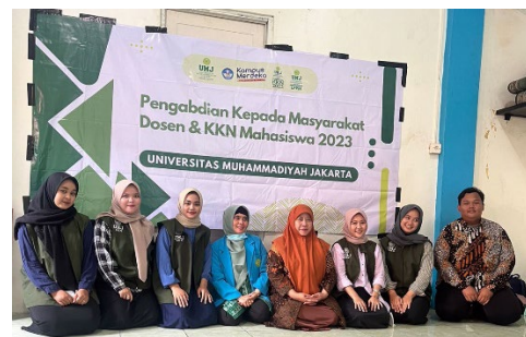
Gambar 2. Penyuluhan kesehatan di RW 08 Karang Anyar, Kecamatan Sawah Besar, Jakarta Pusat

Kegiatan penyuluhan Gizi Seimbang dilaksanakan secara offline pada tanggal 18 Agustus 2023 dimulai pada pukul 09.00 dihadiri oleh 10 peserta ibu hamil. Masyarakat dan ibu hamil menyimak materi yang disampaikan dengan baik.