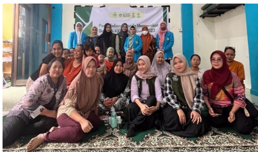
Gambar 4. Foto bersama

Setelah pemaparan materi tentang gizi seimbang dilaksanakan, kegiatan selanjutnya yaitu berupa ice breaking atau Tanya jawab untuk mencairkan suasana agar masyarakat tidak bosan. Sebagai penutup dan tanda terima kasih dari kami kepada masyarakat yang sudah antusias mengikuti kegiatan dari awal kegiatan berlangsung akan diberikan souvenir berupa tempat minum (tumbler). Akhir kegiatan penyuluhan pada tanggal 18 Agustus 2023 ditutup dengan foto bersama yang selesai sekitar pukul 11.00.