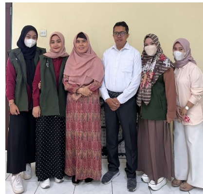
Gambar 1. Rapat Koordinasi KKN di Kampus FIK Cempaka Putih, Jakarta Pusat

Dalam pelaksanaannya kegiatan dilakukan selama 2 hari, dimulai dengan Rapat Koordinasi pada tanggal 14 Agustus 2023 dan pelaksanaan penyuluhan pada tanggal 18 Agustus 2023.