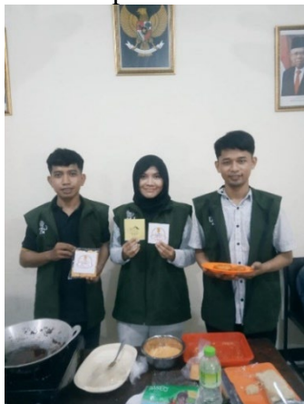
Gambar 8. Pemaparan Packaging Nugget Ampas Tahu Oleh Mahasiswa KKN