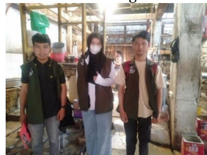
Gambar 3. Mahasiswa KKN

Pada hari Rabu 16 agustus 2023 kami melakukan diskusi program selanjutnya berupa pelatihan pembuatan So nugget Ampas Tahu kepada Masyarakat Jl, Sumber Pelita RT04/RW01,Sumur Batu,Kemayoran,Jakarta Pusat.