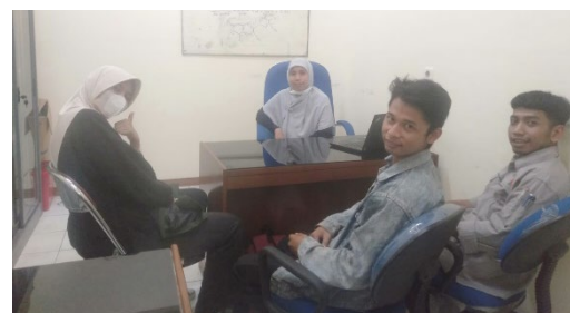
Gambar 4. Diskusi Agenda Pelatihan Di Kampus FT-UMJ

Pada hari Rabu 16 agustus 2023 kami melakukan diskusi program selanjutnya berupa pelatihan pembuatan So nugget Ampas Tahu kepada Masyarakat Jl, Sumber Pelita RT04/RW01,Sumur Batu,Kemayoran,Jakarta Pusat.