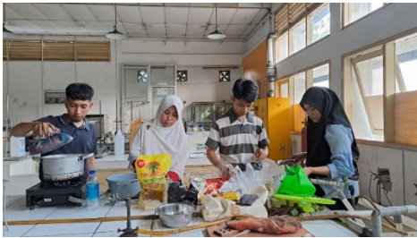
Gambar 6. Pelatihan pembuatan nugget

Senin, 21 Agustus 2023, Pengabdian Masyarakat dengan membuat pelatihan Peningkatan Nilai Ekonomis Ampas Tahu Sebagai Produk Makanan di kantor RW 01 sumur batu, kemayoran.