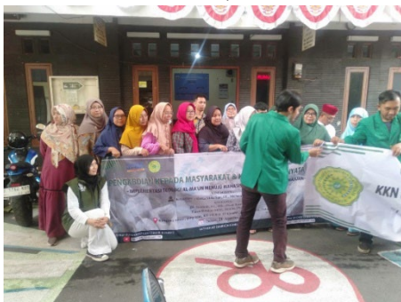
Gambar 8. Foto Bersama Peserta