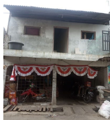
Gambar 2. Pabrik Tahu Mitra H.Endang

kami Melakukan Survey ketempat mitra yakni pabrik tahu h.endang,kami menjelaskan terkait program KKN yang akan kami laksanakan.