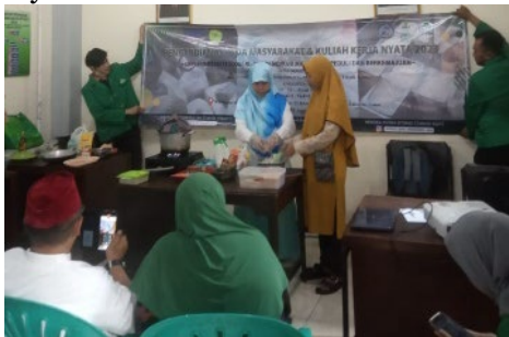
Gambar 7. Pelatihan Pembuatan Nugget Ampas Tahu

Senin, 21 Agustus 2023, Pengabdian Masyarakat dengan membuat pelatihan Peningkatan Nilai Ekonomis Ampas Tahu Sebagai Produk Makanan di kantor RW 01 sumur batu, kemayoran.