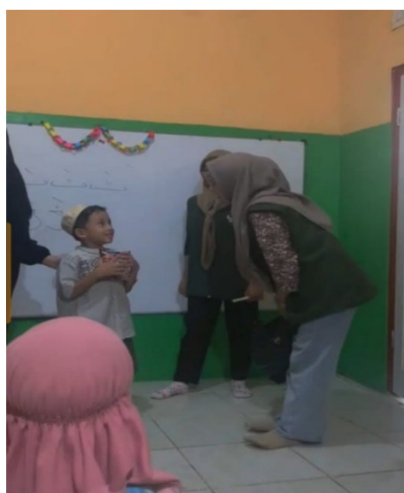
Gambar 3. Pemberian Hadiah Ice Breaking

Sebagai bentuk penutupan mengajar sambil bermain kami melakukan pertanyaan ulang dari apa yang telah kami ajarkan, dan siapa yang bisa menjawab akan mendapatkan hadiah yang telah kami siapkan.