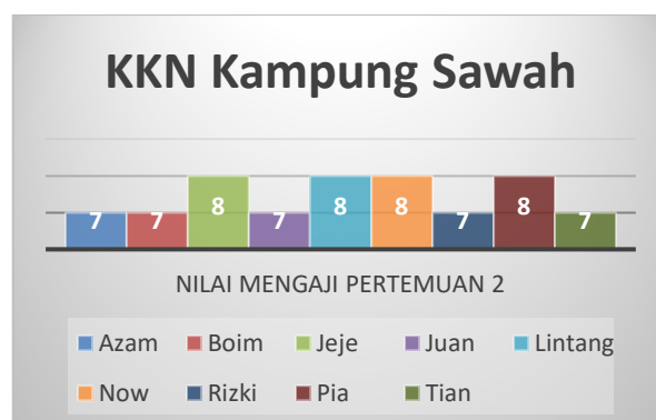
Gambar 5. Tabel nilai mengaji pertemuan 2

Berdasarkan test yang kami lakukan di pertemuan 1 pemahaman siswa belum baik mengenai huruf hijaiyah dan doa sehari hari dengan nilai rata rata 6,1.