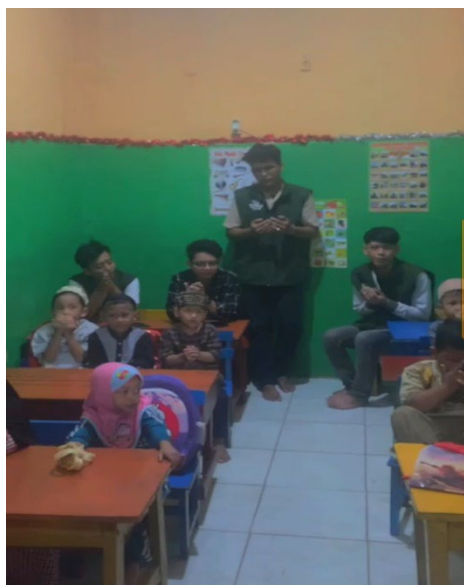
Gambar 2. Menghafal doa sehari hari.

Setelah pengenalan huruf hijaiyah selanjutnya kami melaksanakan kegiatan menghafal doa sehari hari yang meliputi : doa sebelum makan, doa sesudah makan, doa sebelum tidur, doa sesudah tidur, dsb.