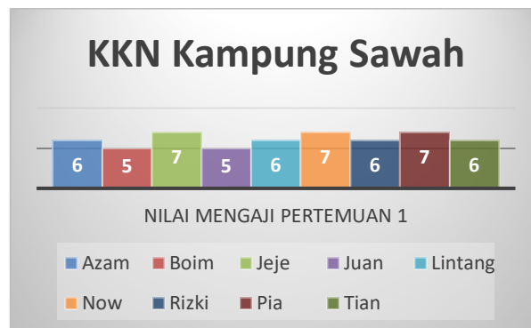
Gambar 4. Tabel nilai mengaji pertemuan 1

Kegiatan Kuliah Kerja Nyata (KKN) berdasarkan hasil observasi dan wawancara yang telah kami lakukan adalah belajar sambil bermain di TK Aisyiyah 16 Kampung Sawah, Jakarta Utara. Dalam pelaksanaannya kegiatan ini dilakukan 2 kali pada tanggal 12 dan 19 agustus 2023.