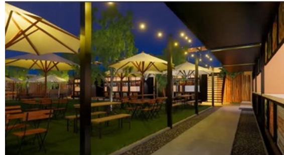
Gambar 2. Ide desain layout