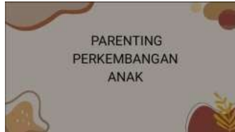
Gambar 7. Materi Parenting Perkembangan Anak

Setelah melakukan pertunjukan oleh siswa/siswi TK Aisyiyah 19, agenda selanjutnya ialah materi sosialisasi mengenai parenting perkembangan anak yang akan disampaikan oleh Lela Arwati. Materi yang disampaikan berisi tentang fase- fase perkembangan, pentingnya parenting, peran penting orang tua dalam perkembangan anak, Teknik parenting dan faktor yang mempengaruhi parenting.