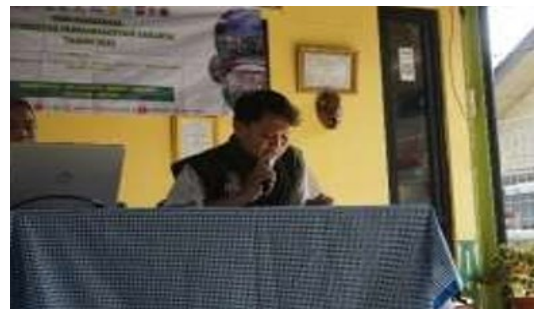
Gambar 2. Pembacaan Tilawatil Quran

Acara sosialisasi dan sharing ini diawali dengan pembukaan dengan membaca basmallah dan pembacaan tilawatil quran.