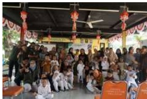
Gambar 11. Sesi foto bersama orang tua siswa/siswi TK Aisyiyah 19

Setelah melakukan sharing bersama orang tua siswa/siswi selanjutnya kami menutup acara dan melakukan sesi foto bersama.