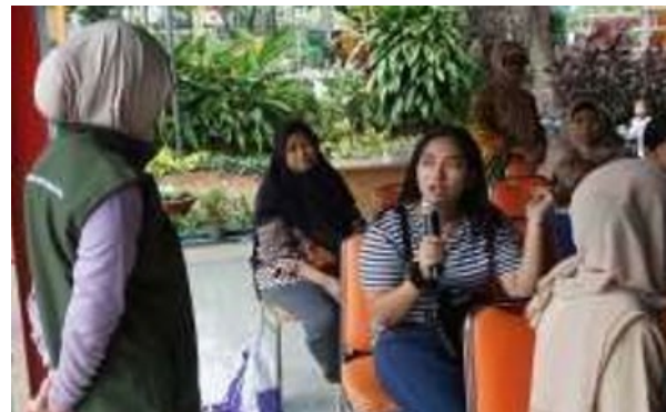
Gambar 10. Kegiatan Sharing Bersama Orang Tua Siswa/Siswi TK Aisyiyah 19

Selain kami menjelaskan materi parenting, kami juga melakukan sharing bersama para orang tua siswa/siswi TK Aisyiyah 19