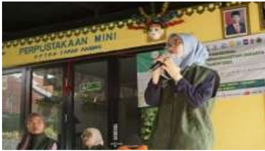
Gambar 4. Sambutan dari Perwakilan Kelompok KKN PCA Tanah Abang 3

Selanjutnya pertunjukan dari siswa/siswi dengan menyanyi bersama dan pembacaan puisi untuk orang tua siswa/siswi TK Aisyiyah 19.