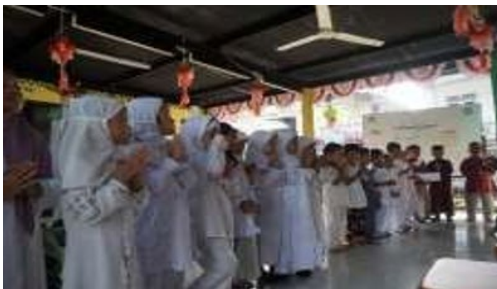
Gambar 5. Pertunjukan dari siswa/siswi TK Aisyiyah 19

Selanjutnya pertunjukan dari siswa/siswi dengan menyanyi bersama dan pembacaan puisi untuk orang tua siswa/siswi TK Aisyiyah 19.