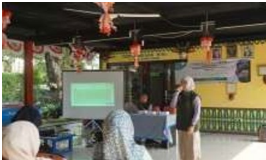
Gambar 1. Menjelaskan mengenai materi perkembangan anak kepada orang tua siswa

Dipilihnya metode ini karena sasaran dalam kegiatan ini adalah orang tua. Sehingga diharapkan orang tua senantiasa mengikuti kemajuan dari tahapan demi tahapan perkembangan anaknya.