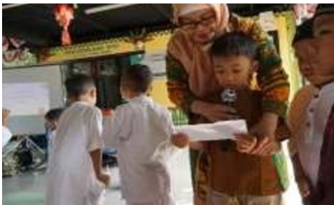
Gambar 6. Pertunjukan dari siswa/siswi

Setelah melakukan pertunjukan oleh siswa/siswi TK Aisyiyah 19, agenda selanjutnya ialah materi sosialisasi mengenai parenting perkembangan anak yang akan disampaikan oleh Lela Arwati. Materi yang disampaikan berisi tentang fase- fase perkembangan, pentingnya parenting, peran penting orang tua dalam perkembangan anak, Teknik parenting dan faktor yang mempengaruhi parenting.