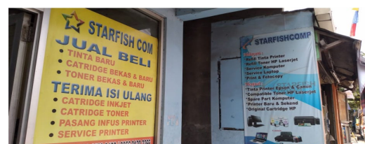
Gambar 1. Plang Usaha

Menurut Shanti Darmastuti tahun 2020 masalah-masalah lingkungan yang terjadi saat ini sedikit banyaknya terjadi karena masalah sampah dan limbah dari kegiatan atau aktivitas manusia. Selain itu menurut Muhammad Haris Fadhillah dan Mohammad Fahreza tahun 2023 mendaur ulang kemasan plastic yang ada adalah salah satu cara analisa ekonomi sirkular di Kabupaten Sumedang. circular economy juga dapat diterapkan hampir ditiap system produksi, tidak hanya pada sistem produksi pangan untuk mencapai konsep industri yang komprehensif dan berkelanjutan ini menurut Nisrina Nurafifah, Avi Marlina dan Rachmadi Nugroho tahun 2021. Bagi Abang Edwin Syarif Agustin, Cama Juli Rianingrum tahun 2019, ditarik kesimpulan bahwa dengan belajar tentang Ekonomi Sirkular dan pengimplementasiannya, maka banyak pihak di masa depan juga akan secara implisit terdidik untuk kesadaran akan pembangunan yang keberlanjutan.