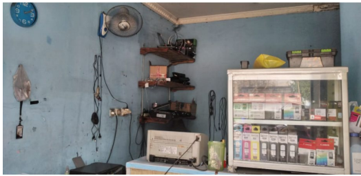
Gambar 2. Bagian dalam CV. SCMG