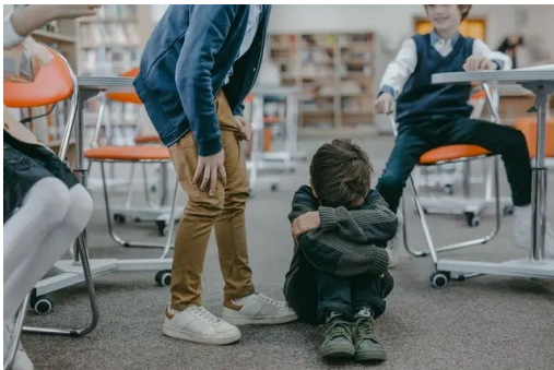
Gambar 1. Bullying di Sekolah

Pentingnya topik ini tergambar dalam perhatian yang semakin meningkat dari komunitas akademik, praktisi pendidikan, dan pemerintah. Upaya intensif telah dilakukan untuk mengidentifikasi strategi yang efektif dalam mengatasi masalah ini. Penelitian-penelitian sebelumnya telah mengungkapkan dampak negatif bullying, mencoba memahami penyebabnya, dan mencari solusi yang tepat untuk menguranginya.