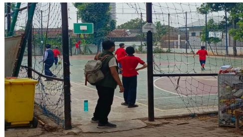
Gambar 6. Observasi lapangan di SMP Lab School FIP UMJ sebagai aula