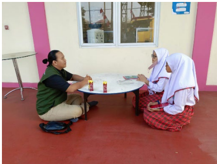
Gambar 2. Wawancara pada para siswi di SMP Lab School FIP UMJ

Setelah mewawancarai para murid dan juga guru dari yang kami dapat untuk saat ini bullying pada sekolah SMP Lab school FIP UMJ jarang sekali terjadi disekolah dikarenakan metode pengajaran yang ramah dan baik dari para guru kepada muridnya.