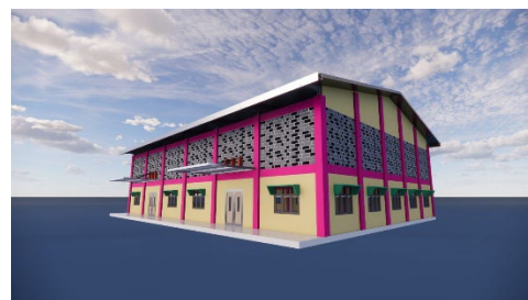
Gambar 7. Desain Perspektif Gedung serba guna 1

Setelah kami melakukan observasi pada lapangan yang direncanakan untuk Pembangunan Gedung Serba Guna (aula). Kami mengetahui bahwa lapangan yang akan kami desain untuk perencanaan Pembangunan memiliki luas 30m x 40m kemudian kami membuat 2 desain sebagai usulan desain yang kami serahkan kepada kepala sekolah SMP Lab School FIP UMJ.