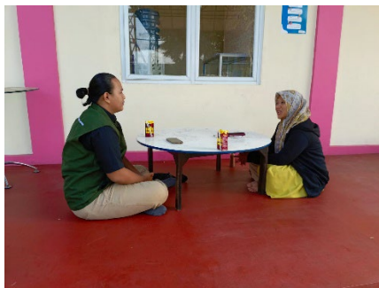
Gambar 3. Wawancara pada guru di SMP Lab School FIP UMJ