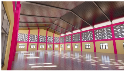
Gambar 8. Desain Dalam Gedung serba guna 1