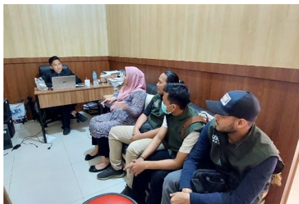
Gambar 4. Wawancara pada Kepala Sekolah di SMP Lab School FIP UMJ