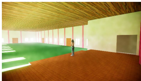
Gambar 10. Desain Dalam Gedung serba guna 2