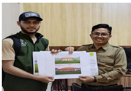
Gambar 12. Penyerahan gambar desain 2