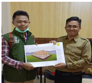
Gambar 11. Penyerahan gambar desain 1 kepada kepala sekolah