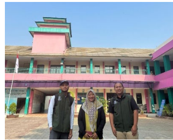
Gambar 5. Tinjauan Lapangan di SMP Lab School FIP UMJ

Kami meninjau lapangan dengan cara memasuki beberapa kelas untuk melihat kondisi para siswa dan siswi di sekolah. Kemudian kami mengobservasi lapangan yang akan di rencanakan untuk Pembangunan aula yang akan kami berikan usulan desain.