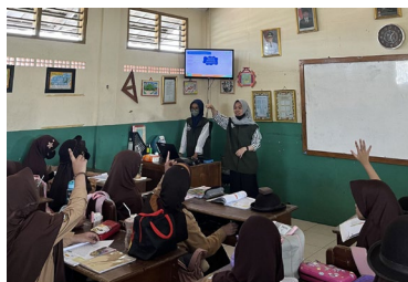
Gambar 2. Kegiatan mengajar di SDIT An-Nuriyah Jakarta

Berdasarkan hasil yang terdapat pada tabel, dapat dilihat bahwa rata-rata hasil kuis dari kelas 1 sampai kelas 6 mendapat nilai yang memuaskan. Hal ini dapat menunjukkan bahwa pelajaran yang disampaikan oleh mahasiswa telah diterima dengan baik oleh para murid dari SDIT An-Nuriyah.