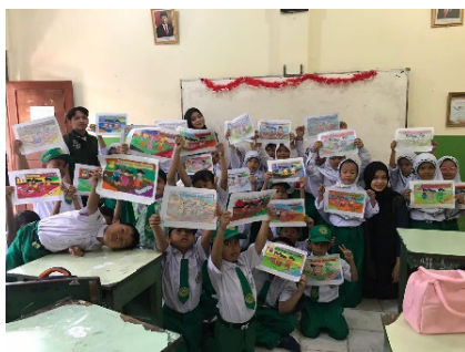
Gambar 3. Foto bersama siswa-siswi MIS Al-Hidayah