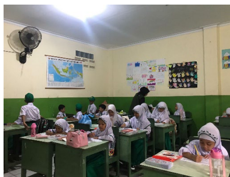
Gambar 1. Pelaksanaan Kegiatan

Pelaksanaan Kegiatan KKN PKM Universitas Muhammadiyah Jakarta Kelompok25 Tahun Akademik 2022-2023