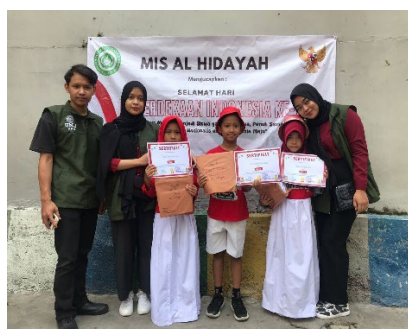
Gambar 4. Foto bersama siswa/i pemenang kelas 1a