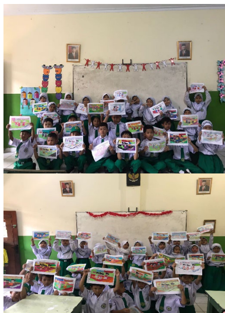
Gambar 2. Hasil gambar siswa-siswi lomba mewarnai

Evaluasi pelaksanaan Kuliah Kerja Nyata (KKN) PKM adalah merupakan ukuran dimana untuk mengetahui sejauh mana program KKN PKM ini terlaksana. Program kerja yang telah dilaksanakan di kecamatan Ciputat Timur yaitu pelaksanaan program “Lomba mewarnai untuk siswa/i MIS Al-Hidayah dalam rangka HUT RI 78” Walaupun demikian, kami menganggap bahwa pelaksanaan dari Kuliah Kerja Nyata (KKN) ini masih terdapat kekurangan atau hambatan yang perlu dari para tokoh masyarakat beserta seluruh pembimbing guna menjadi evaluasi kedepannya sebagai solusi alternative dari hambatan yg dilaksanakan.