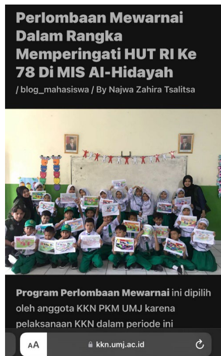
Blog Mahasiswa kkn.umj.ac.id