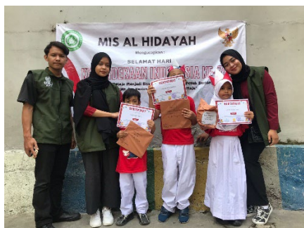
Gambar 5. Foto bersama siswa/i pemenang kelas 1b