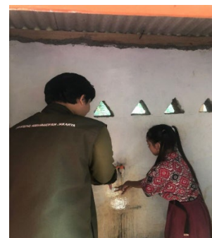
Gambar 6 Praktek Cuci Tangan

Setelah susunan acara sudah terlaksana semua anak-anak di ajak Mahasiswa KKN untuk melakukan praktek