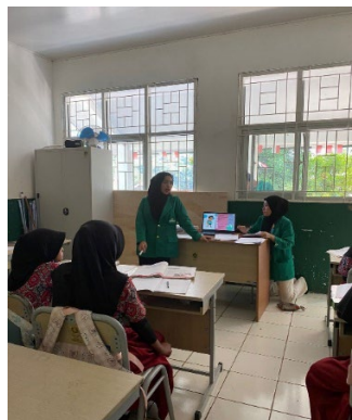
Gambar 3. Pemaparan Materi PHBS

Setelah anak-anak selesai mengisi Pre-Test yang diberikan Mahasiswa KKN selanjutnya adalah ke acara yang paling utama yaitu pemaparan materi tentang Perilaku Hidup Bersih dan Sehat (PHBS) yang akan dijelaskan oleh Mahasiswa KKN.