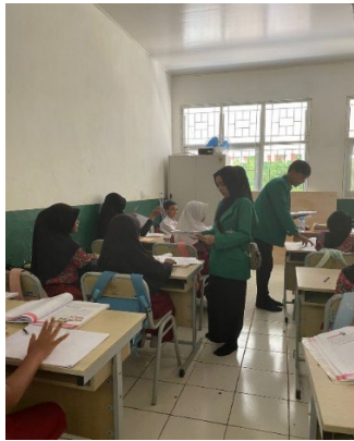
Gambar 2. Memberikan Pre-Test

Kegiatan selanjutnya yaitu sebelum pemaparan materi tentang PHBS di mulai Mahasiswa KKN memberikan selebaran Pre-Test terlebih dahulu dimana Anak SD harus mengisi Pre-Test tersebut untuk mengetahui apakah yang mereka ketahui tentang PHBS.