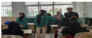
Gambar 8 Penutup

Selanjutnya setelah sesi foto bersama selesai anak-anak masuk ke kelas kembali, dan Mahasiswa KKN serta Dosen Pembimbing izin berpamitan dan berterima kasih atas waktu yang diberikan.