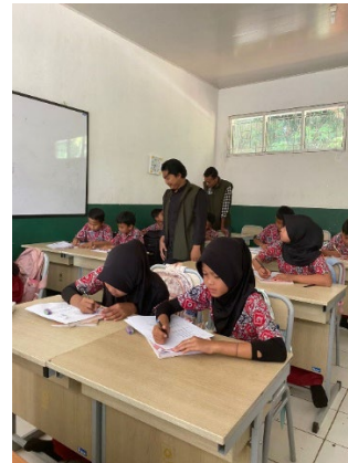
Gambar 4. Memberikan Post-Test

Setelah anak-anak memperhatikan pemaparan materi PHBS, Mahasiswa KKN memberikan Post-Test dimana untuk mengetahui seberapa jauh pemahaman anak-anak setelah materi PHBS tersebut diberikan Mahasiswa KKN.