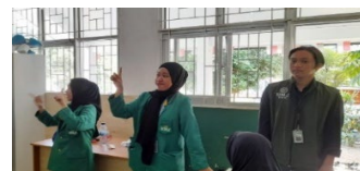
Gambar 5 Sesi Tanya Jawab

Selanjutnya selesai anak-anak menyelesaikan mengisi Post-Test, diadakan Sesi Tanya Jawab bagi anak-anak yang masih belum paham tentang PHBS.