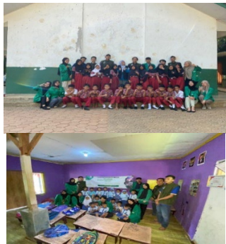
Gambar 7 Sesi Foto Bersama

Kegiatan telah selesai dan diakhiri dengan foto bersama anak-anak dan mahasiswa KKN.