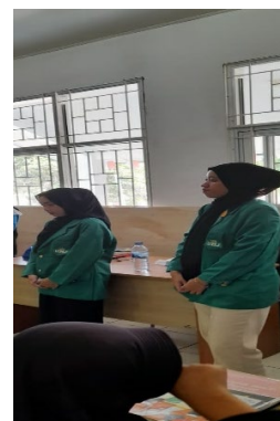
Gambar 1. Pembukaan Acara Oleh Kelompok KKN