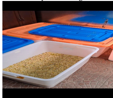
Gambar 2. Hasil Rajangan Kulit Buah

Misalkan volume wadah 10 Liter maka volume air maksimal 6 Liter (air sama dengan 6 Kg), gula 600 gram, sisa buah atau sayuran 1800 gram.