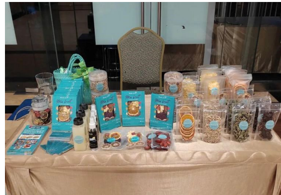
Gambar 4. Produk Siap Dijual

Pengemasan produk Herbor.id ini menggunakan plastik dan kardus primer yang tujuannya adalah menjaga lebih baik kualitas produk hingga ke tangan konsumen, selain itu kemasan plastik berupa botol spray dan paper clip memudahkan konsumen dalam penggunaan produk dan penyimpanan kembali.