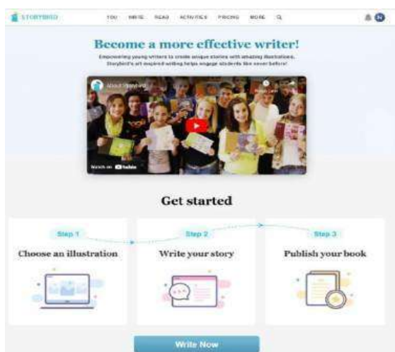
Gambar 4. Storybird.com