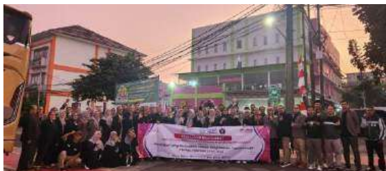
Gambar 1. Keberangkatan ke Subang Acara pengabdian masyarakat dimulai dengan sesi gabungan, diawali dengan sambutan dari pihak sekolah dan perwakilan FIP UMJ, dilanjutkan dengan ramah tamah serta sesi foto bersama.

Kegiatan pengabdian masyarakat ini merupakan bagian dari program yang dilaksanakan oleh seluruh program studi di Fakultas Ilmu Pendidikan (FIP) UMJ. Dalam kegiatan ini, seluruh dosen dan tenaga kependidikan FIP UMJ mengunjungi SMP Muhammadiyah Subang.