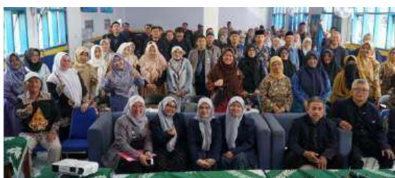
Gambar 3. Foto bersama guru

Setelah itu, kegiatan berlanjut ke sesi paralel dari masing-masing program studi yang memberikan materi kepada para guru SMP Muhammadiyah Subang.