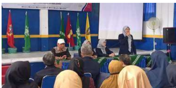
Gambar 2. Sambutan dari FIP UMJ