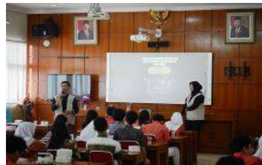
Gambar 3. Pelaksanaan Penyuluhan Pendidikan Berbasis Digitalisasi

terhadap kegiatan KKN. Walaupun secara umum lancar tetapi masih terdapat hambatan-hambatan kecil yang dapat membuat program berjalan kurang optimal.