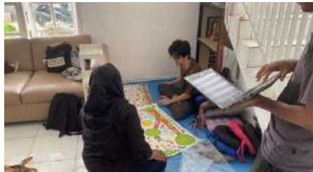
Gambar 3. Proses Pembuatan Pojok Literasi

penyusunan buku yang didonasikan dan ditutup dengan menyusun bantal dudukan agar anak-anak yatim disana semangat dan nyaman membaca dan belajar buku. Berikut foto proses pembuatan pojok literasi.