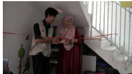
Gambar 6. Peresmian Pojok Literasi Oleh Ketua Pelaksana dengan Perwakilan Mitra

Dari seluruh rangkaian kegiatan, “Langkah Berbagi Ceria” menunjukkan seberapa pentingnya untuk memberdaya anak-anak yatim dan keluarga dhuafa lewat kerjasama dengan yayasan yang mengurus mereka. Mahasiswa Universitas Muhammadiyah Jakarta bersama dengan Mitra Rumah Belajar Yatim YAPEPAM sudah cukup berhasil untuk memberdaya anak-anak disana. Hal ini sejalan dengan kegiatan pengabdian masyarakat sebelumnya, yang menjelaskan bahwa pojok baca mampu meningkatkan semangat minat baca dan rasa ingin tahu anak-anak yatim di tempat mereka tinggal dan belajar menimba ilmu (Prananda, 2023).