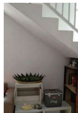
Gambar 2. Tempat Pojok Literasi Sebelum di buat

Kemudian pada Jumat 16 Agustus 2024, telah dilakukan diskusi dan riset untuk penentuan lokasi pojok literasi. Sehingga diputuskan pojok literasi dibuat di tempat kosong di bawah tangga rumah belajar tersebut. Berikut foto tempat pojok literasi sebelum dikerjakan dan dirapihkan.