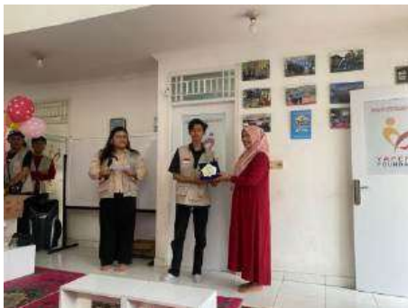
Gambar 4. Penyerahan Plakat Tanda Perpisahan