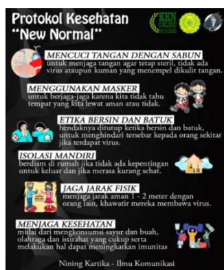
Gambar 2. Pembuatan Poster