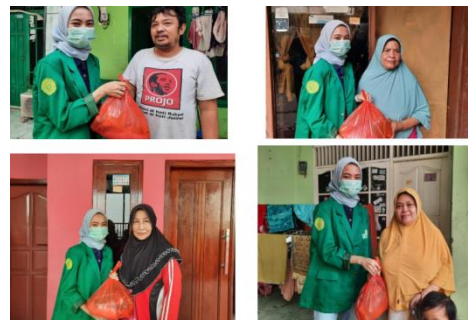
Gambar 4. Kegiatan Pembagian Sembako

Program UMJ PEDULI ini dilaksanakan di Desa Sukabumi Selatan, Kebon Jeruk dengan membagikan sembako kepada masyarakat yang terkena dampak COVID-19.