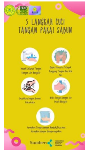
Gambar 4. Poster Edukasi

masyarakat luas memahami bagaimana mencuci tangan yang baik dan benar serta dapat memanfaatkan tanaman yang ada disekitarnya.