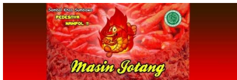
Gambar 2. Produk Masin Gotang

Pelaksanaan kegiatan KKN di bidang Ekonomi yakni Pendampingan Industri Kecil Menengah (IKM). Industri Kecil Menengah adalah industri yang memiliki skala kecil dan menengah. Pendampingan IKM yang dilakukan ialah pembuatan video tutorial Masin untuk membantu IKM dalam memasarkan dan mempromisikan produknya.