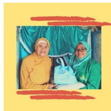
Gambar 5. Pemberian Baksos

UMJ Peduli merupakan program wajib KKN dengan cara memberikan bantuan berupa sembako kepada masyarakat sekitar atau tetangga yang membutuhkan. Di masa pandemik covid-19 yang belum kunjung berakhir ini, sudah seharusnya saling mengulurkan tangan memberikan bantuan kepada masyarakat yang membutuhkan.