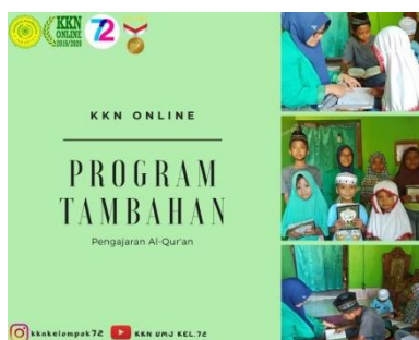
Gambar 3. Kegiatan mengajar Al-Quran

Kegiatan mengajar mengaji di salah satu TPA yang ada di tempat wilayah KKN berlangsung. Mengajar Al-Qur'an di TPA tersebut bertujuan untuk menjalin silaturahmi dan juga membantu pengajar dalam mengajarkan Al-Qur'an kepada peserta didik menggunakan model pengajaran yang lebih menarik, sehingga peserta didik dapat membaca Al-Qur'an dengan baik dan benar sesuai dengan tajwid.