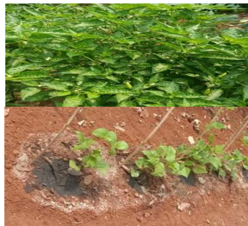
Gambar 1. Tanaman yang subur