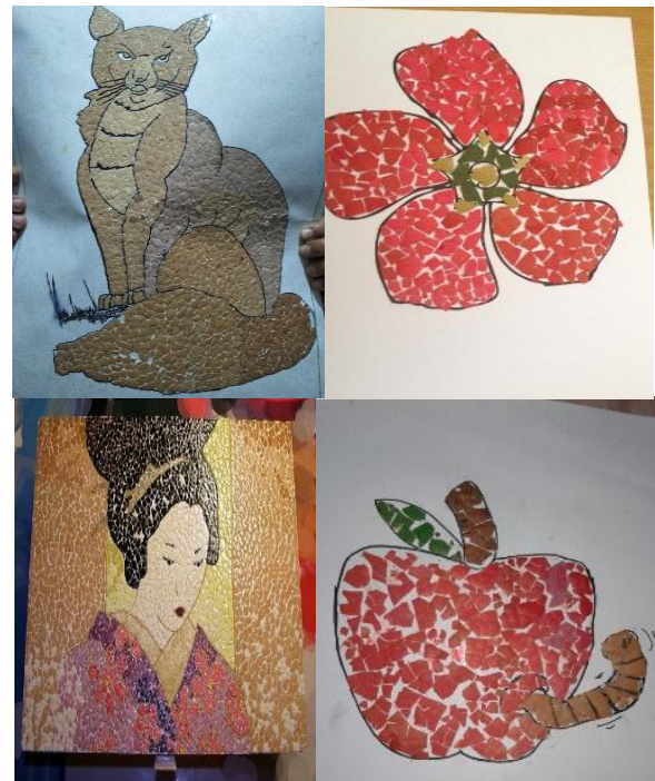
Gambar 2. Pembuatan Mozaik Cangkang telur