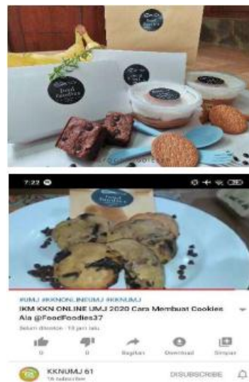
Gambar 2. Pemasaran IKM di Youtube

Keuntungan untuk usaha Food Foodies dari diadakannya kegiatan ini adalah pemasaran produknya akan semakin luas, meningkatkan omset dan dapat memberikan pengaruh positif bagi para penonton Video tersebut untuk terus produktif walaupun di rumah. Dalam kegiatan ini juga, kami melakukan Foto Produk untuk selanjutnya foto tersebut dapat dishare ke social media sebagai bentuk promosi yang dilakukan oleh semua anggota KKN kelompok 61.