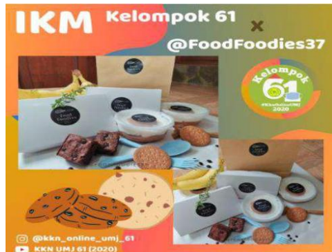
Gambar 3. Pemasaran IKM di Instagram

https://republika.co.id/berita/pux1g1/apa-perbedaan-ikm-dan-ukm