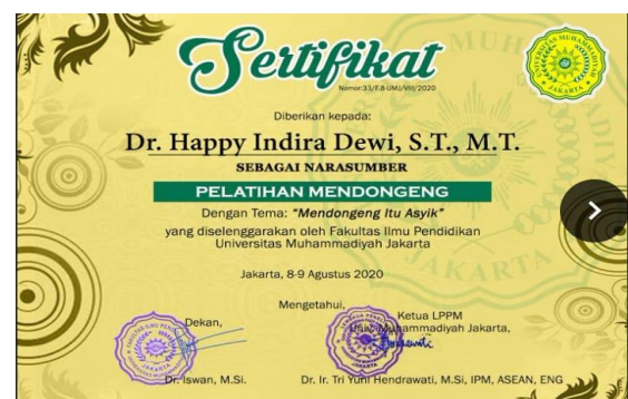
Gambar 6. Persiapan Pembuatan Sertifikat Pelatihan

Koordinator pelaksana dan dokumentasi pelatihan, kemudian mulai membuat sertifikat narasumber dan peserta pelatihan, dari data absensi kehadiran. Kemudian menyiapkan pengiriman hadiah kuota pulsa bagi pemenang lomba mendongeng sebesar, juara 1, juara 2 dan juara 3, dan mendokumentasikan serta menyimpan hasil kegiatan pelatihan pengmas Mendongeng Itu Asyik secara Daring.