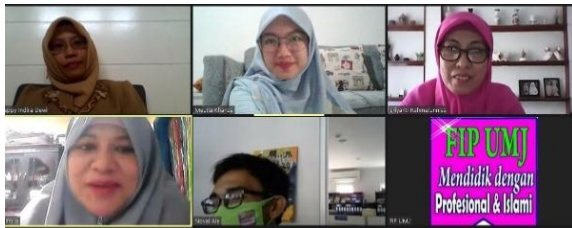
Gambar 7. Gladiresik Pelatihan Mendongeng Itu Asyik

Koordinator pelaksana dan dokumentasi pelatihan memberikan link Zoom untuk acara Gladiresik Pelaksanaan Pelatihan Mendongeng Itu Asyik.