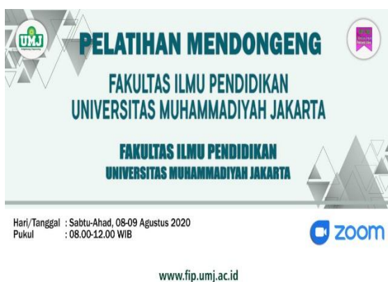
Gambar 4. Alternatif Background Untuk Narasumber Yang Terpilih Alternatif ke 3