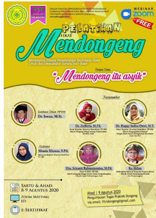
Gambar 2. Poster Digital Untuk Pelatihan Mendongeng Itu Asyik