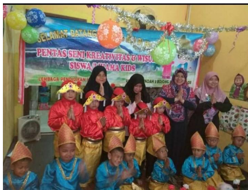
Gambar 1. TK Hiyama Kids Sebagai Penggerak Keberlanjutan Kegiatan Mendongeng Itu Asyik

Visi TK Hiyama Kids adalah Menciptakan generasi Qur'ani yang cerdas, kreatif, inovatif, dan profesional dalam menghadapi tantangan zaman. Adapun misi dari TK Hiyama Kids ada 3 yaitu: 1) Mengimplementasikan nilai-nilai Islam ke dalam lingkungan pembelajar; 2) Mengasah dan mengoptimalkan potensi siswa untuk mencapai multi intelegensi; 3) Menciptakan kreativitas siswa sehingga menjadi menjadi asset bangsa yang bermanfaat.