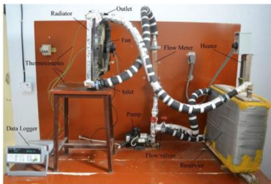
Gambar 2. Setup eksperimen untuk ZnO/air nanofluida yang digunakan untuk mengukur perpindahan panas [51]

Heris dkk. [46] mempelajari CuO/(campuran air/EG 60/40) dan mereka menemukan bahwa bilangan Nusselt bergantung pada bilangan Reynolds, konsentrasi, dan suhu masuk. Suhu outlet menunjukkan berkurang dengan bertambahnya konsentrasi. Sandya dkk. [47] menyelidiki TiO 2 /air-EG (40:60) di radiator dan menyebutkan bahwa menggunakan nanofluida memiliki banyak dampak pada perpindahan panas. Untuk hanya 0,5% dari nanofluida 35% peningkatan perpindahan panas telah diamati. Temperatur masuk memiliki efek yang lebih kecil pada perpindahan panas [48-50].