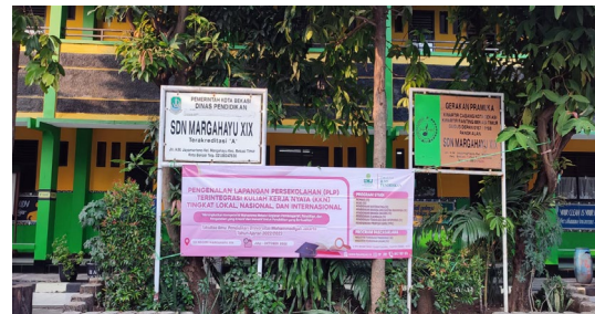
Gambar 2. SDN Margahayu XIX

Lingkungan SDN Margahayu XIX adalah lingkungan yang berada dari salah satu Kelurahan Margahayu RT 014/ RW 010, Kecamatan Bekasi Timur, Kota Bekasi. Penelitian ini dilakukan hanya di dalam lingkup SDN Margahayu VI yang melibatkan peserta didik anak SD Kelas 2 di lingkungan SDN Margahayu XIX.