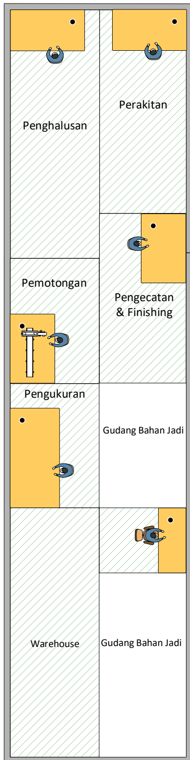
Gambar 4. Penataan ulang tata letak departemen dan fasilitas Fadhel Furniture

Penataan ulang usulan ini juga dapat mengurangi proses material handling yang terjadi pada proses pembuatan Furniture. Selain itu juga berdampak pada