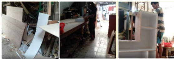
Gambar 1. Tata Letak Fasilitas Produksi UKM Fadhel Furniture

Salah satu sektor perekonomian andalan yang ada di Indonesia adalah Sektor Usaha Kecil dan menengah (UKM) (Ahmad & Susantiaji, 2020). UKM merupakan sebuah usaha yang cukup memberikan pemberdayaan bagi masyarakat sekitar dalam bentuk penyediaan lapangan kerja. Salah satu UKM yang cukup berkembang baik adalah UKM Fadhel Furniture yang berlokasi di Pahlawan Komarudin RT. 08/ 005 Ujung Karawang, Cakung, Jakarta Timur, yang bergerak dibidang manufaktur yang memproduksi produk furniture. Proses pembuatan furniture di UKM Fadhel terdiri dari tahapan pengukuran dan pemotongan, Pembuatan pola sadar, penyerutan, penghalusan, perakitan, pemasangan aksesoris, pengecatan, finishing dan pengeringan. Dapat dilihat pada gambar 1. layout dari beberapa proses pembuatan produk furniture yang ada di UKM Fadhel Furniture.