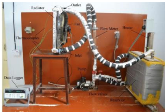
Gambar 2. Setup eksperimental untuk ZnO/air nanofluida yang digunakan untuk mengukur perpindahan panas [51]

Heris dkk. [46] mempelajari CuO/(campuran air/EG 60/40) dan mereka menemukan bahwa bilangan Nusselt bergantung pada bilangan Reynolds, konsentrasi, dan suhu masuk. Suhu outlet menunjukkan berkurang dengan bertambahnya konsentrasi. Sandya dkk. [47] menyelidiki TiO 2 /air-EG (40:60) di radiator dan menyebutkan bahwa menggunakan nanofluida memiliki banyak dampak pada perpindahan panas. Untuk hanya 0,5% dari nanofluida 35% peningkatan perpindahan panas telah diamati. Temperatur masuk memiliki efek yang lebih kecil pada perpindahan panas [48-50].