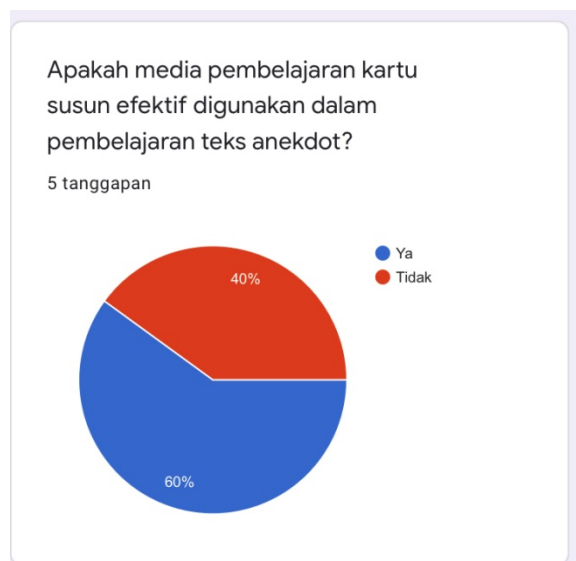
Gambar 6. Respon peserta didik pertanyaan kelima

Jumlah presentase kusioner ini juga menjadi bukti bahwa penggunaan media pembelajaran kartu susun dapat menarik perhatian peserta didik saat pembelajaran berlangsung. Maka dari itu, penting bagi pengajar untuk mempersiapkan media pembelajaran yang sesuai dengan kebutuhan dan tujuan pembelajaran diterapkan terus menerus.