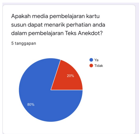
Gambar 5. Respon peserta didik pertanyaan keempat

Hal tersebut dapat dilihat melalui presentase tanggapan peserta didik sebesar 80%. Dari data tersebut peserta didik merasa penggunaan media kartu susun dalam pembelajaran teks anekdot sangat membantu pemahaman materi mengenai teks anekdot sampai pada keterampilan menulis teks anekdot. Maka dapat disimpulkan bahwa penggunaan media pembelajaran kartu susun ini sangat berpengaruh terhadap pemahaman dan meningkatkan keterampilan menulis teks anekdot peserta didik.