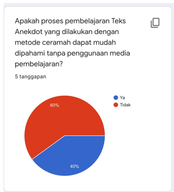
Gambar 2. Respon peserta didik pertanyaan pertama

Data selanjutnya bisa dilihat melalui responden kuesioner peserta didik setelah melakukan pembelajaran tidak menggunakan media pembelajaran dengan menggunakan media pembelajaran kartu susun. Pembelajaran menulis teks anekdot mendapatkan respon yang baik dari peserta didik dan merasa lebih terbantu memahami apa yang dipelajari dengan menggunakan media pembelajaran. Penggunaan media pembelajaran kartu susun memudahkan peserta didik untuk memahami struktur dari suatu teks anekdot. Serta memahami pesan yang tersirat dalam isi teks anekdot.