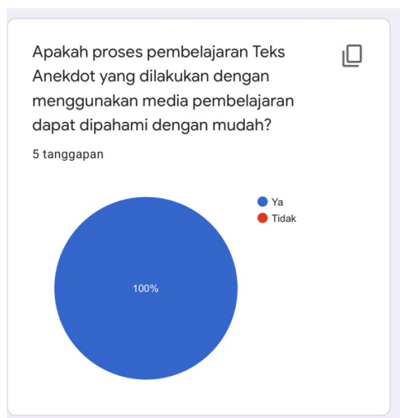
Gambar 3. Respon peserta didik pertanyaan kedua

Penggunaan media pembelajaran juga berdampak langsung pada proses pembelajaran. Di saat kondisi seperti ini penggunaan media pembelajaran menjadi media bantu pengajar untuk menyampaikan materi pembelajaran serta membantu menarik minat peserta didik dan variasi belajar. Manfaat media pembelajaran bagi pengajar sendiri dapat digunakan sebagai wadah penyampaian materi. Sementara itu, media pembelajaran bagi peserta didik melatih daya pikir untuk lebih mengolah materi sesuai yang disampaikan oleh pengajar untuk mencapai tujuan.