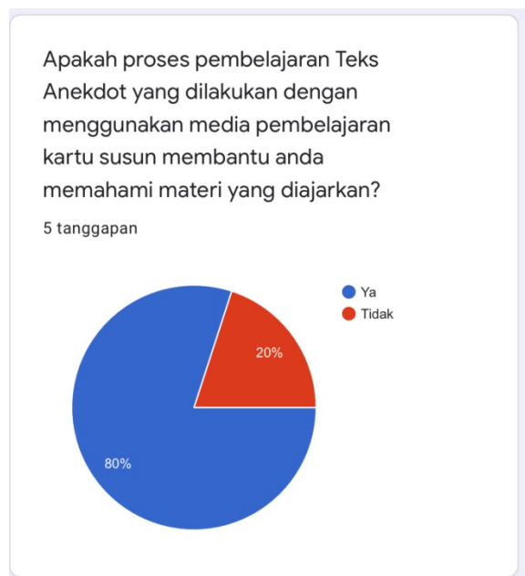
Gambar 4. Respon peserta didik pertanyaan ketiga

Memanfaatkan media pembelajaran pun bisa mengurangi kesan peserta didik bahwa pelajaran bahasa Indonesia membosankan, hanya berpacu pada teks dan teori, tidak perlu belajar pasti paham, maupun anggapan lainnya. Bila kita melihat respon dari kuesioner tersebut, tentu sudah terlihat jelas peserta didik sangat antusias bila pembelajaran bahasa Indonesia menggunakan media pembelajaran. Dengan adanya hal ini, lambat laun kesan kurang baik peserta didik terhadap pembelajaran bahasa Indonesia pasti akan berubah.