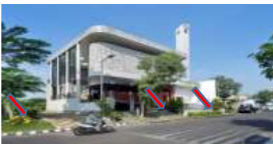
Gambar 7 : Masjid Honeycomb

Pada site masjid Honeycomb bangun di sekeliling dekat dengan area lahan kosong dan berdekatan dengan rumah vegetasi bangunan di buat di halaman bangunan.