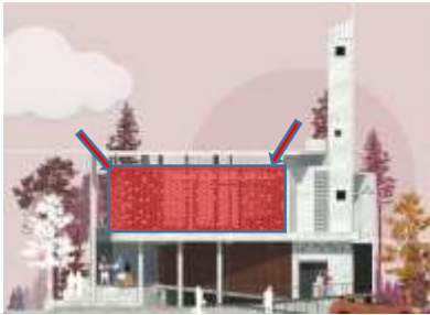
Gambar 5 : Masjid Honeycomb

karena bangunan yang terbuka pemisahan antara dinding dan kolom membuat udara menjadi optimal.