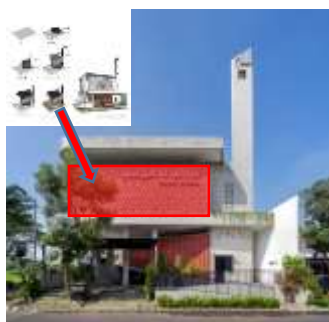
Gambar 2 : Gubahan Massa Masjid Honeycomb

Masjid Honeycomb mengambil konsep sarang lebah bentukan dinding dinding bangunan masjid ini membentuk sarang lebah yang menutupi bangunan, kolom bangunan yang menerus dan menopang atap, menjadikan bangunan seperti di payungi oleh atap