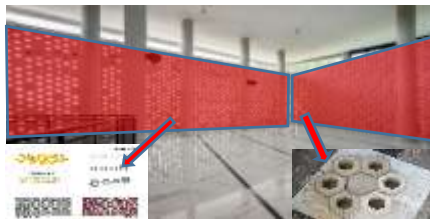
Gambar 1 : Bagian Dalam Masjid Honeycomb

Bangunan masjid Honeycomb terlihat bangunan yang di selubungi material batu/roster, masjid ini mengambil konsep dari sarang lebah, dinding yang mengelilingi bangunan membuat bangunan terlihat seperti sarang lebah, pada bangunan masjid Honeycomb membuat bangunan tersebut tidak kekurangan cahaya dan udara yang masuk cukup untuk membuat sirkulasi berjalan di dalam bangunan atau berfungsi sebagai cross ventilation.