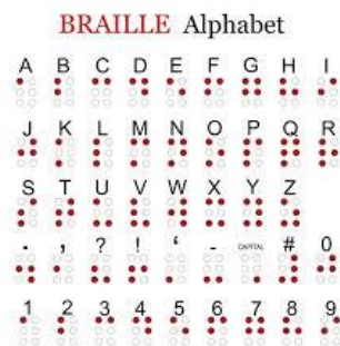
Gambar 1. Huruf dan angka Braille (Dewi, 2017)

Huruf Braille untuk huruf dan angka yang titik terdiri dari 6 buah titik terlihat pada gambar 1.