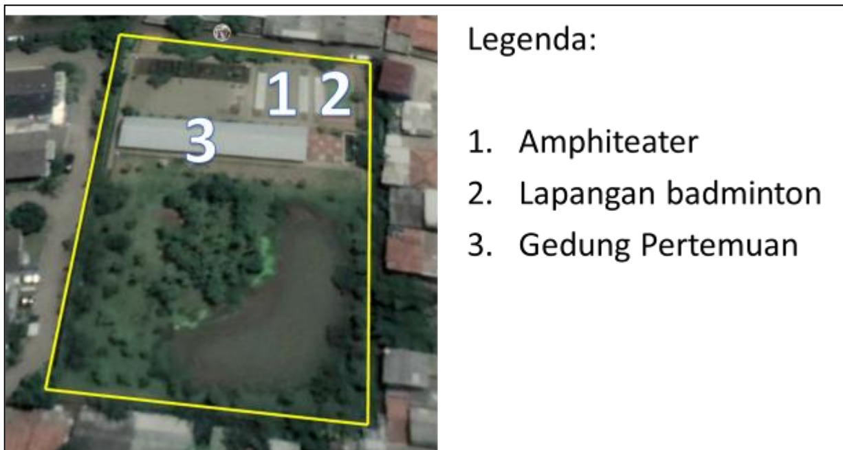
Gambar 4. Peletakan bangunan lanskap pada Taman Jangkrik