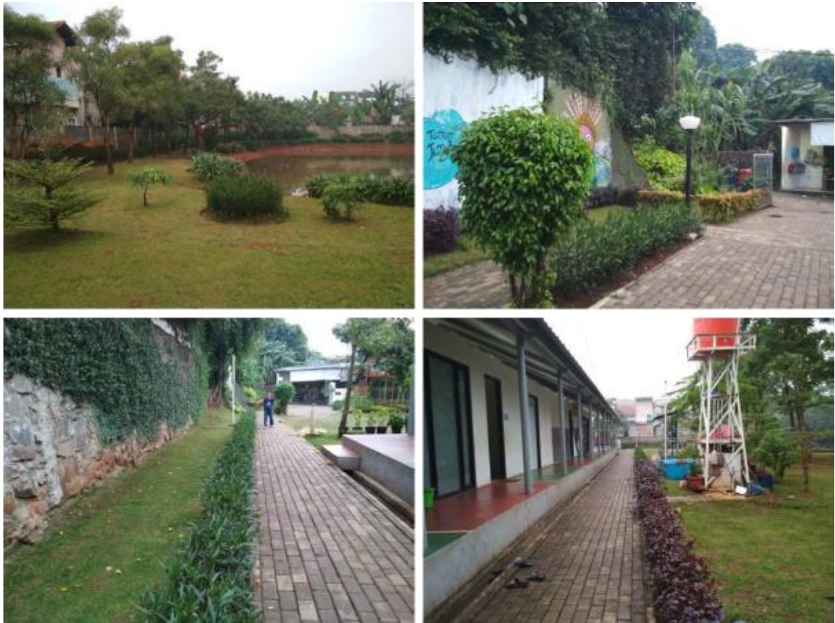
Gambar 3. Vegetasi dominan pada Taman Jangkrik