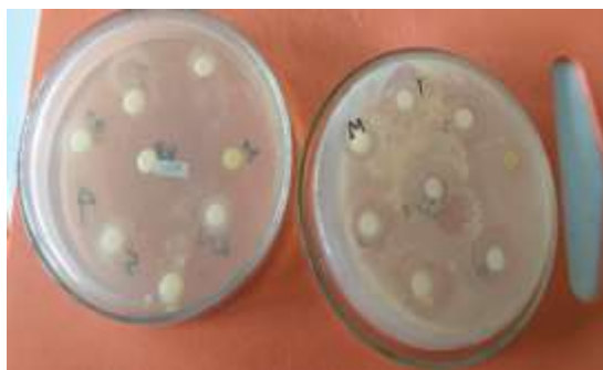
Gambar 2. Kemampuan penghambatan mikroba eschericia coli dan staphylococcus aureus

Dari gambar 2 dan tabel 2 menunjukkan kemampuan penghambatan mikroba eschericia coli tetap pada berbagai variabel yaitu sebesar 8 mm dan kemampuan penghambatan mikroba staphylococcus aureus meningkat, terlihat peningkatan terbesar pada konsentrasi ekstrak minyak dedak padi 10% sebesar 21 mm. Hasil uji penghambatan mikroba menunjukkan bahwa ekstrak minyak dedak padi mempunyai kemampuan menghambat mikroba Esherichia coli dan Staphylococcus aureus . Kemampuan penghambatan mikroba dapat digolongkan menjadi golongan lemah jika < 5 mm, sedang 5-10 mm, kuat 10-20 mm, dan sangat kuat >20