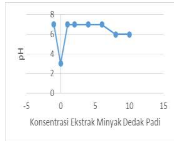
Gambar 1. Grafik konsentrasi ekstrak minyak dedak padi terhadap pH sabun cair

Hasil Uji korelasi antara konsentrasi ekstrak minyak dedak padi dengan pH sabun cair dapat dilihat pada Gambar 1.