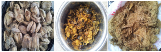
Gambar 1. Proses perlakuan dan perendaman serat 5% NaOH selama 1 jam.