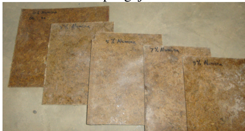
Gambar 10. Biokomposit polimer serat fraksi volume serat 30%, dengan penambahan berat alumina 0, 3, 5, 7, dan 9%