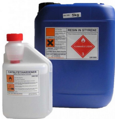
Gambar 2. Resin polyester dan hardener