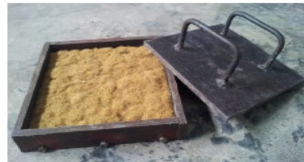
Gambar 6. Serat kulit buah pinang dimasukkan dalam cetakan