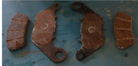
Gambar 11. Biokomposit kampas rem