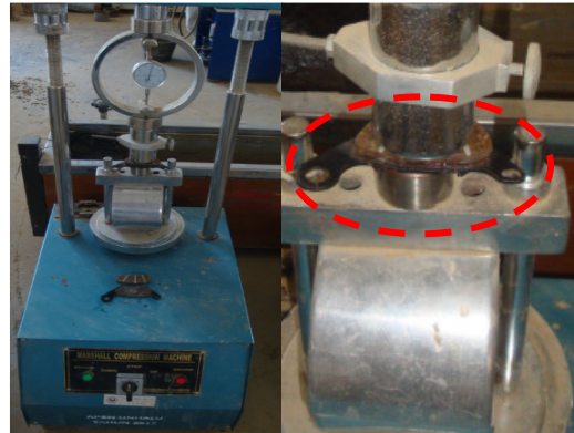
Gambar 12. Pemasangan kampas pada lempeng dudukan