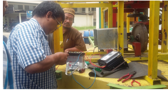
Gbr. Pengujian untuk pengisian accu/batere.

Pengujian berikutnya akan dilakukan real di pantai dengan memanfaatkan ombak/gelombang laut. Mudahan didapat daya yang lebih besar.