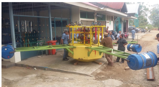
Gbr. Ponton lengkap saat akan di uji coba.