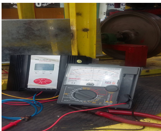
Gbr. Hasil Pengujian dengan digoyang manual, menghasilkan listrik 1,2 A 24 Volt.