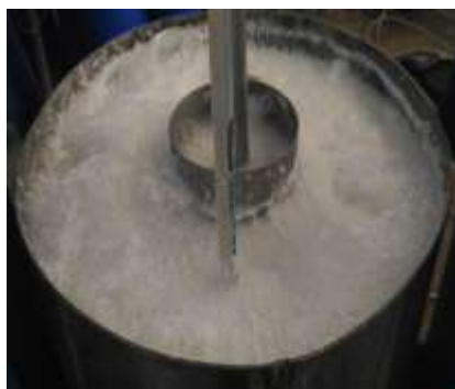
Gambar 1. Proses karbonatasi

Proses pembuatan magnesium karbonat yang dilakukan di Pusat Penelitian Metalurgi dan Material LIPI dimulai dari proses kalsinasi dolomit pada temperature lebih dari 700^\circ C selama 8 jam. Hasil dari proses kalsinasi selanjutnya dilakukan proses slaking hingga terbentuk slurry magnesium hidroksida.