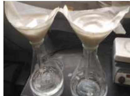
Gambar 2. Hasil saringan berupa larutan bening dan limbah padatan dalam saringan.

Slurry tersebut kemudian dilakukan proses karbonatasi dengan cara menambahkan lumpur hasil dari slaking ke dalam aquadest dengan perbandingan 1 g per 20 ml. Proses karbonatasi dilakukan pada temperatur kamar selama 45 menit. Kemudian dilakukan proses filtrasi dan padatan yang tertahan di kertas saring adalah limbah sedangkan filtratnya adalah larutan magnesium bikarbonat.