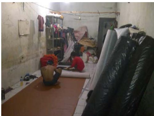
Gambar 1 Divisi Jahit dan Pengukuran

CV Banua memiliki beberapa ruang yaitu ruang bahan baku atau material, ruang produksi yang terdiri dari beberapa alur proses dalam pembuatan tas dan ruang produk jadi. Fasilitas yang ada di tiap ruangan tidak tertata dengan baik dan masih berantakan sehingga dapat memperlambat dalam proses bekerja. Kondisi ini dapat dilihat pada gambar 1 :