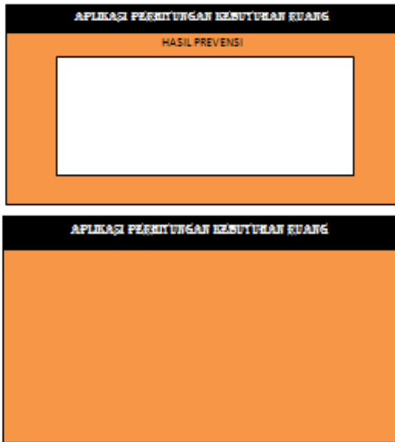
Gambar 3 tampilan aplikasi