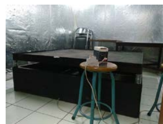
Gambar 3. Foto lantai getar