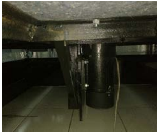
Gambar 4. Motor penggerak