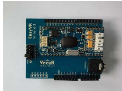
Gambar 2.1 Easy Voice Recognition Module(Easy VRM)

Speech recognition : merupakan proses yang dilakukan komputer untuk identifikasi suara yang diucapkan oleh seseorang tanpa memperdulikan identitas orang terkait. Implementasi speech recognition misalnya perintah suara untuk menjalankan aplikasi komputer. Parameter yang dibandingkan ialah waktu pengucapan dan tingkat penekanan suara terutama suara vokal yang kemudian akan dicocokkan dengan template database yang tersedia. Alat yang digunakan untuk melatih perintah suara untuk input peralatan kontrol adalah Easy Voice Recognition (Easy VR) shield 3 seperti gambar 2.1 di bawah ini.