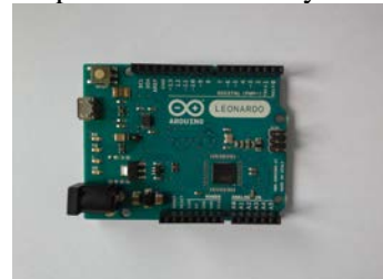
Gambar 2.3 Arduino Leonardo

Penggunaan chip ATmega32u4 membawa perubahan yang sangat besar pada desain Arduino. Terlebih dapat mengeliminasi penggunaan chip USB to serial converter, yang hal ini berdampak pada harga board yang jauh lebih murah dari board-board Arduino standar sebelumnya. Chip ini selain memungkinkan Anda untuk memprogram Arduino, dapat juga dikenali oleh komputer Anda sebagai perangkat seperti mouse dan keyboard.