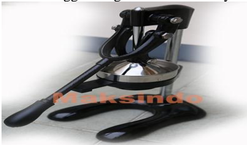
Gambar 1. Alat Pemeras Sari Jeruk

Dengan mengutip penulisan jurnal dari S Wijaya (2011) repository.ubaya.ac.id dimana alat yang sejenis pernah dirancang dengan sistem kerjanya buah jeruk ditusuk lalu ditekan sehingga mengeluarkan air sarinya.