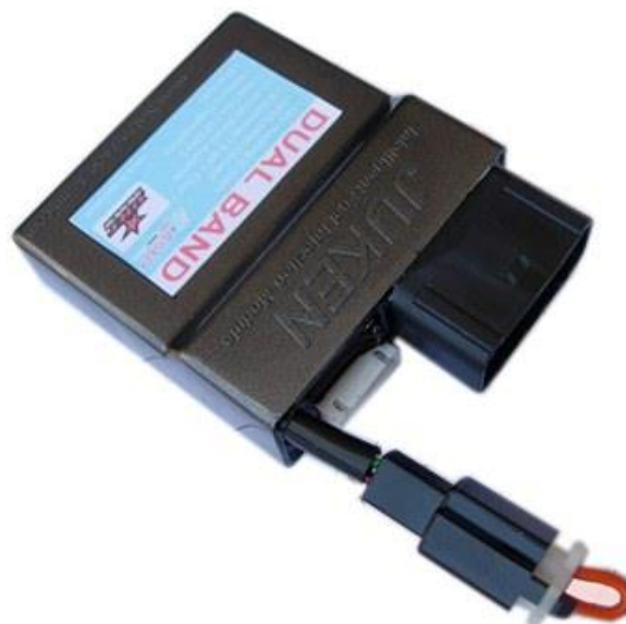
Gambar 1. ECU BRT Juken