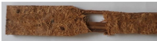
Gambar 3. Jenis patahan uji tarik komposit serat dan lidi kelapa

Adanya lidi kelapa dalam komposit hibrid tidak memberikan pengaruh yang signifikan terhadap kekuatan tarik komposit. Hal ini dapat diamati dari struktur patahannya, dimana semua tipe sampel mengalami kegagalan pull out seperti ditunjukkan pada gambar 3. Walaupun lidi kelapa mendapatkan perlakuan awal berupa perendaman dengan larutan alkali, namun tidak memberikan pengaruh yang berarti terhadap kekuatannya. Gambar 4 memperlihatkan penampang lidi yang ditanam pada resin polyester. Terlihat bahwa permukaan lidi terdapat lapisan bagian luar yang membungkus susunan mikro fibril. Lapisan ini yang menyebabkan matrik tidak bisa mengikat dengan efektif pada permukaan lidi untuk menghasilkan ikatan yang kuat antara matrik dan lidi kelapa. Kondisi ini memberikan informasi bahwa kemampuan daya serap lidi atau sifat wettability kurang baik walaupun telah dilakukan dengan perendaman NaOH