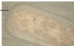
Gambar 4. Penampang melintang lidi kelapa yang ditanam pada matrik (foto mikro pembesaran 50x)